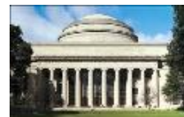
Instituto Tecnológico de Massachusetts (MIT)

Experiencia global de la Universidad del Siglo XXI: Durante los meses de Enero, Febrero y Marzo de 2015, la Sociedad para el Aprendizaje Organizativo, SoL España, y la Sociedad Nuclear Española SNE, organizaron HUB Madrid, un grupo abierto para la participación en el Curso Masivo, Abierto Online (MOOC) del Instituto Tecnológico de Massachusetts (MIT):