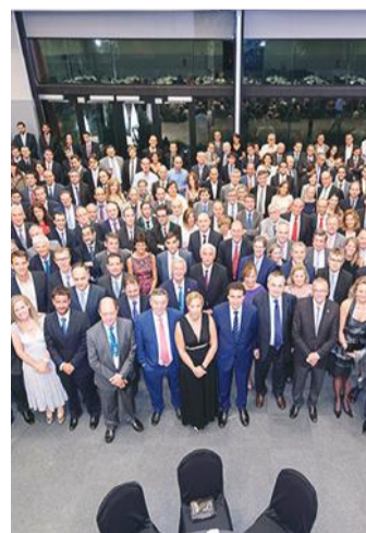
Reunión de la Sociedad Nuclear.

Con el objetivo de hacer de su Reunión Anual un punto de encuentro más sostenible, la Junta Directiva de la Sociedad Nuclear Española ha decidido poner en marcha, este año, la propuesta presentada por las empresas Medidas Ambientales y Grupo Eulen, participantes y expositores de la reunión, para realizar el Cálculo, Verificación y Compensación en la Huella CO2. Más de 600 congresistas participarán en